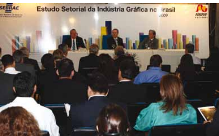
O Estudo, apresentado a empresários gráficos do DF, subsidiará ações específicas para o segmento gráfico.

Em parceria com o Sebrae Nacional, a Associação Brasileira da Indústria Gráfica (Abigraf) lançou no dia 26 de agosto, em Brasília, o Estudo Setorial da Indústria Gráfica no Brasil. Levantamento mais completo produzido no país sobre o segmento, o inédito trabalho traz informações detalhadas sobre o parque gráfico brasileiro, além de identificar os principais problemas que afetam o setor e de propor ações nas áreas de tributação, qualificação de pessoal, mercado e financiamentos.