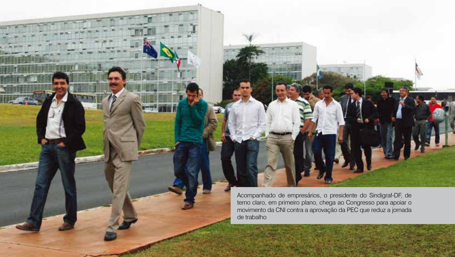
Acompanhado de empresários, o presidente do Sindigraf-DF, de terno claro, em primeiro plano, chega ao Congresso para apoiar o movimento da CNI contra a aprovação da PEC que reduz a jornada de trabalho

Segundo o parlamentar, o argumento de que reduzir a jornada de trabalho irá aumentar a contratação de pessoal não é verdadeiro. “Isso é uma falácia. A hipótese de que a redução induz a empresa a contratar