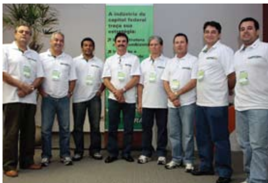
[ Comitiva do Sindigraf no evento ]

pequeno se levarmos em conta que o DF não tinha um perfil exportador e que as indústrias eram bastante limitadas. Mas o resultado torna-se expressivo se compararmos com a evolução ao longo dos últimos 11 anos”, afirmou. Segundo ele, em 1997, as indústrias exportaram US$ 8,033 milhões, e o crescimento das exportações começaram a se evidenciar a partir de 2005, quando se registrou US$ 60,1 milhões em vendas para o mercado externo. Rocha acredita que, com a valorização do dólar frente ao real, as vendas externas podem fechar o ano de 2008 em US$ 190 milhões.